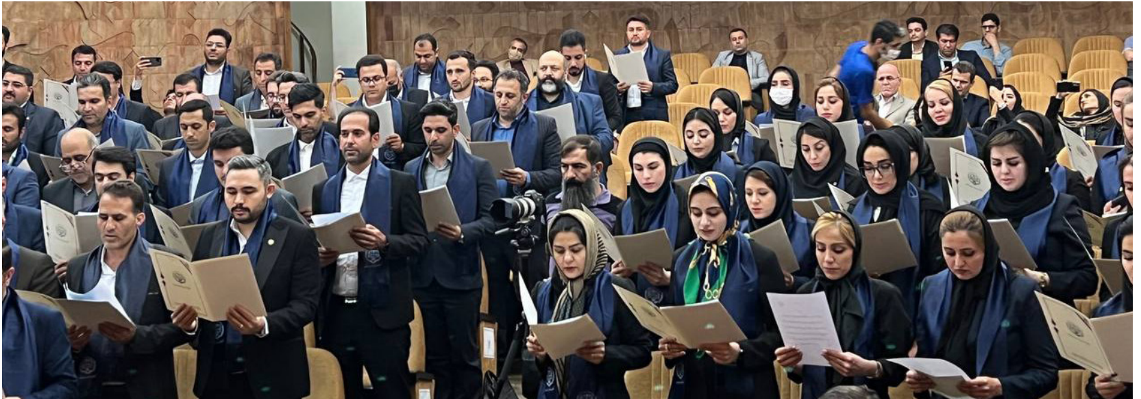
عکس‌های اختصاصی حامی عدالت